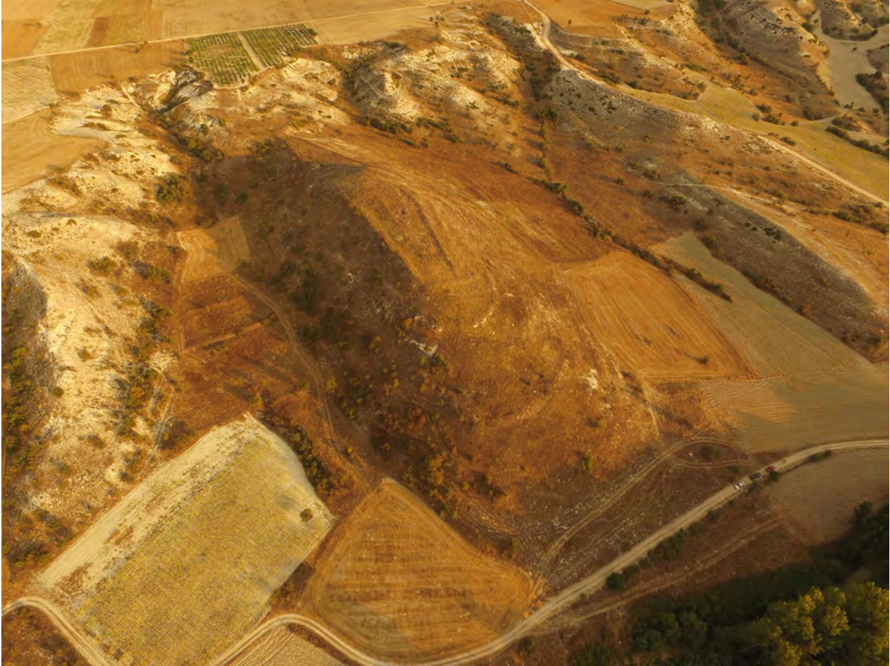
Resim 2: AŐaĐiseyit Höyük havadan görünümü