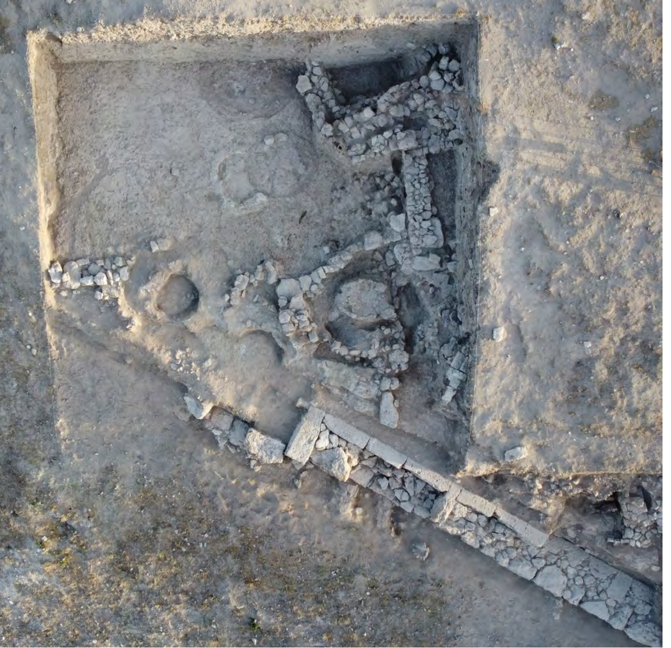
Resim 4: Z21 ve AA22 plankareleri sur duvarı ve GTÇ mimarisi

Hellenistik-Erken Roma dönemlerinde savunma sisteminin bir parçası olarak kullanıldığı düşünülmektedir. Höyüğün konumu ve elde edilen ilk mimari unsurlar dikkate alındığında yerleşimin Geç Hellenistik ve Erken Roma dönemlerinde küçük bir kale veya karakol/garnizon olarak kullanılmış olabileceğini ortaya koymaktadır.