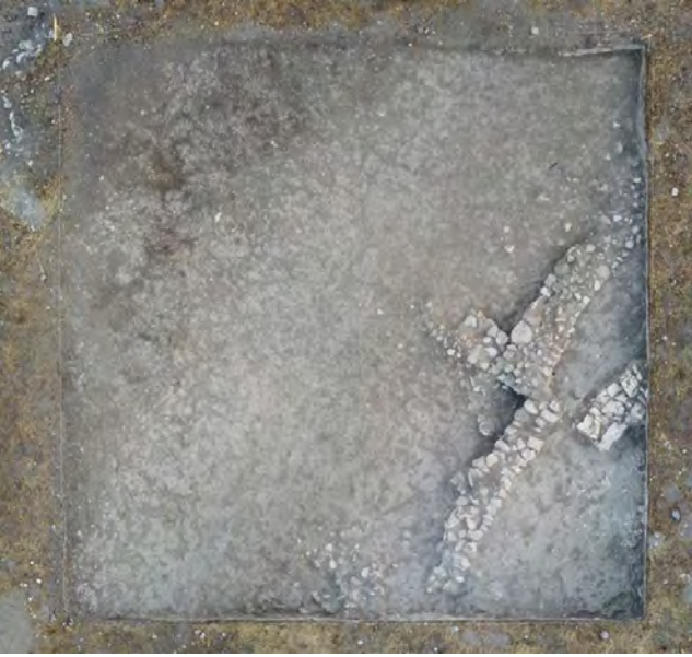
Resim 3: N11 plankaresinde tespit edilen tabakalar

Açığa çıkartılan yapı grubunun tabanında gerekse açmanın genelinde bulunan seramiklerin büyük bölümü Geç Helenistik-Erken Roma Dönemine tarihlenmekte olup ayrıca III Antiochos dönemine ait bir sikke de bulunmuştur.