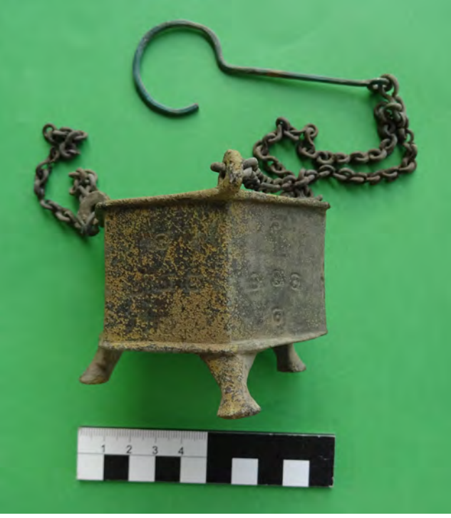
Resim 6: Bronz Buhurdanlık

Bazilika'ya ait olan ve Kilisede kullanılan Korinth Sütun başlıkları, Kör Çörten parçaları, üzerinde bir haç figürü ile başlayan ve ΘECICTO şeklinde Latince bir yazıt olan parapet parçası, kenarları gioş motifi ile çevrili alan içinde bitkisel dal ve yaprak bezemeleri donatılmış parapet parçaları, merkezde de iç içe geçmiş daireler ve bunların merkezinde rozet, çiçek ve haç motiflerinin olduğu parapet parçaları dikkat çekmektedir. Yine çalışmalar sırasında birçok heykel parçası da tespit edilmiştir ki bunlar arasında M.S. 2. yüzyıla tarihlenen Geç Antoninler, Erken Severuslar Dönemi'ne ait Khimationlu heykel parçası dikkat çekicidir. Bu parça, beyaz mermerden yapılmış bir heykelin diz kapağından aşağısına aittir. Khimation giyimli bir kadın heykeli olan parça sağ ayağı dik sol ayağı dizden hafif kırık ve altta ince giysisinin diz kapağını belirgin kılan halinin gösterildiği bir duruş sergilemektedir. Antoninler dönemi boyunca yapılan portrelerde, dönemin stil özellikleri arasında ön plana çıkan elbise kıvrımları ile ilgili detayları bu heykel parçası üzerinde görmekteyiz. Özellikle iki bacağın arasında yoğunlaşan derin elbise kıvrımlarının aralarının boş ve kaba hareketleri vurgular biçimde yapılması, kıvrımların aralarının geniş olması, yine kıvrımların belli bir noktadan başlayıp bir noktada bitmesi gibi detaylar heykel parçasının Geç Antoninler dönemi heykeltraşlık örneklerinden biri olabileceğini göstermesi açısından önemlidir.